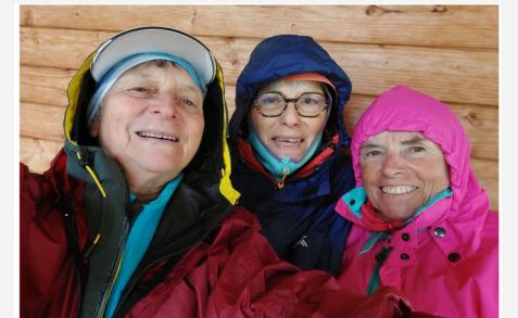
Rando 2 jours