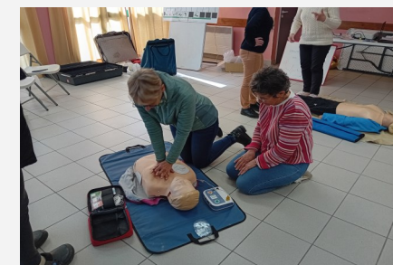
Formation lers secours