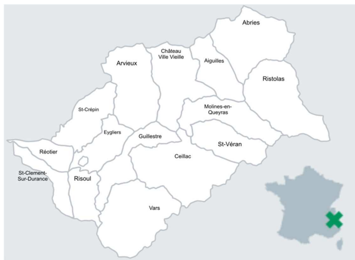
Figure 1 – Les communautés de communes du Guillestrois et du Queyras